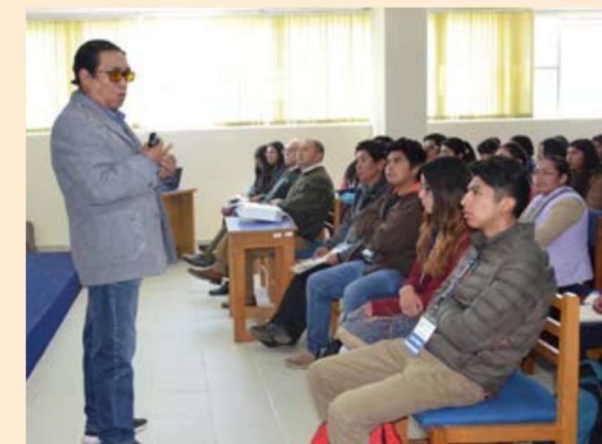
Durante el Encuentro de Economistas de Bolivia se desarrollaron casi 300 sesiones paralelas

Asimismo, se llevó adelante el Encuentro Nacional de las Redes de Economía y una charla especial del expositor principal Jorge Robledo, destinada a los jóvenes bolivianos con miras al encuentro "Asís 2020: Economía con Francisco", que organiza el Papa en el Vaticano.