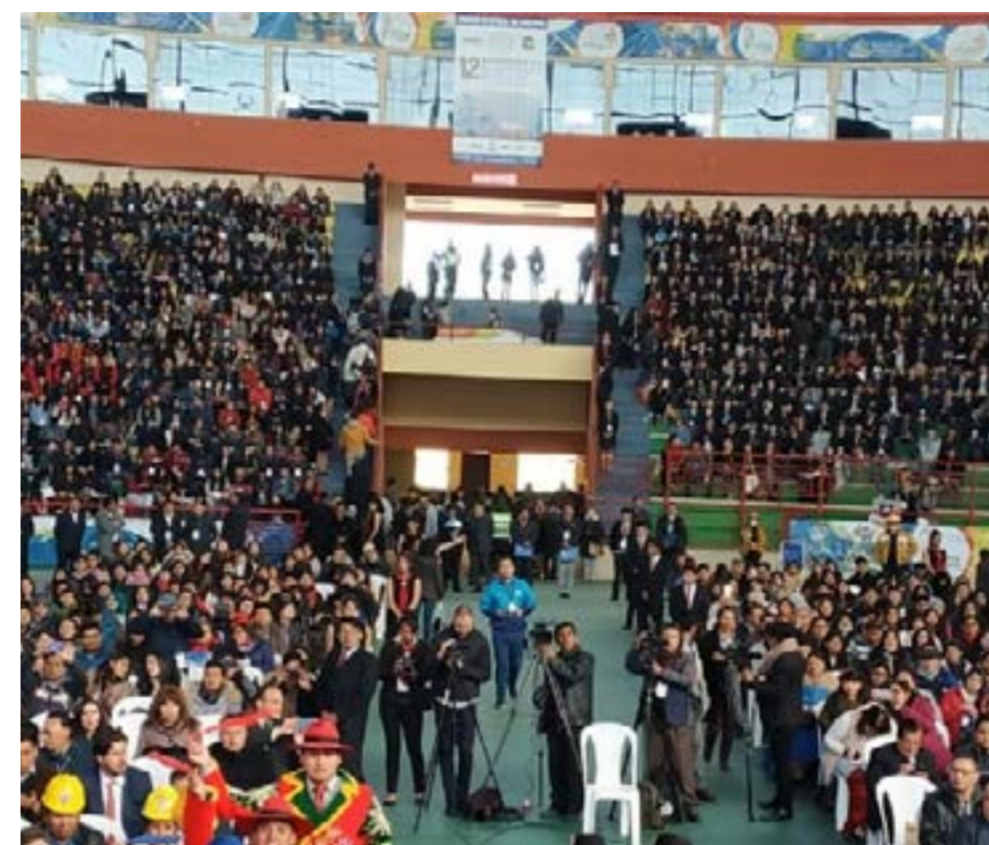
En el 12 Encuentro de Economistas de Bolivia se inscribió a más de 8.000 personas

En su intervención, el Embajador de la República Popular China, Liang Yu, con relación a la guerra comercial chino-estadounidense indicó: "nuestra posición y determinación es consistente y clara, China no quiere pelear, pero, tampoco tiene miedo de pelear, va a pelear si es necesario. Si Estados Unidos está dispuesto a negociar en base al principio de igualdad, le abriremos la puerta, si Estados Unidos insiste en agravar las fricciones comerciales, le acompañaremos hasta el final".