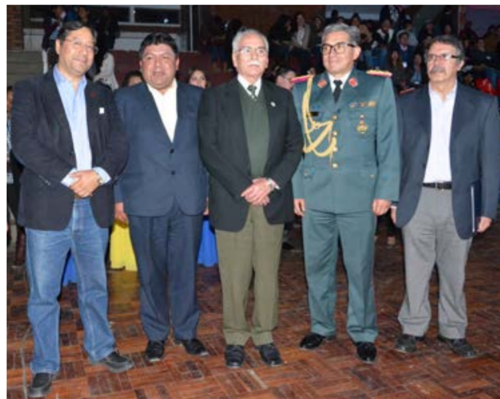
Luis Arce Catacora Ministro de Economía y Finanzas Públicas, Freddy Medrano Alanoca - Rector UPEA, Pablo Ramos Sánchez - Presidente BCB, Gral. DAEN Rommel Morón Romero - Rector EMI y Gabriel Herbas Camacho Vicepresidente de Directorio del BCB

Durante las sesiones plenarias de clausura se presentaron casos de países en el marco del tema central del Encuentro.