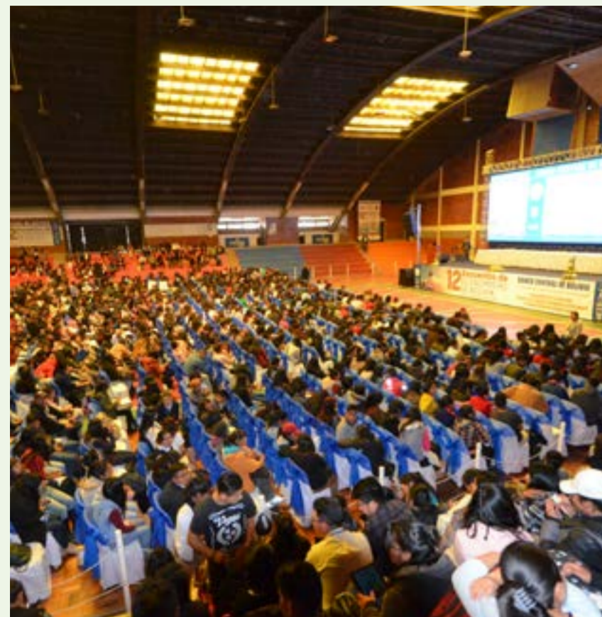
Clausura del 12 Encuentro de Economistas de Bolivia

El Encuentro de Economistas de Bolivia fue coorganizado con dos casas de estudios superiores por primera vez. En la gestión 2016, la Escuela Militar de Ingeniería (EMI) solicitó al Banco Central de Bolivia coorganizar el Encuentro y en 2018 lo hizo la Universidad Pública de El Alto (UPEA). El Directorio del BCB consideró las solicitudes y decidió que el BCB coorganizaría el 12EEB con ambas universidades.