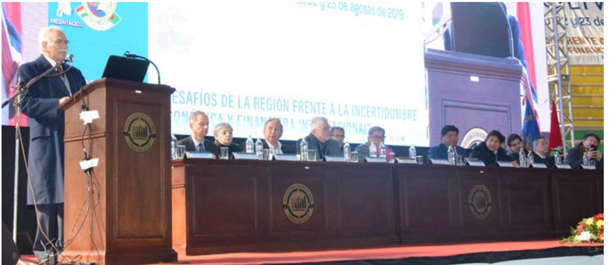
Acto de inauguración del 12 Encuentro de Economistas de Bolivia