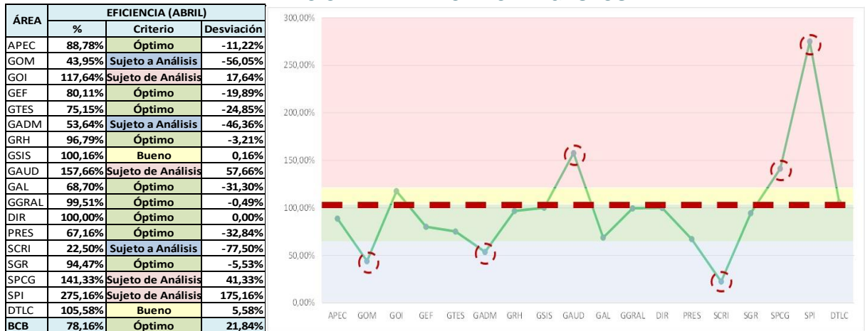
Gráfico N° 3 MEDICIÓN DE LA EFICIENCIA – GASTOS