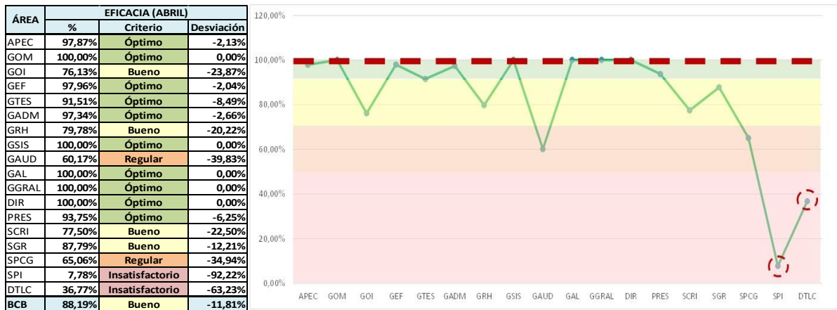
Gráfico N° 1 MEDICIÓN DE LA EFICACIA - GASTOS