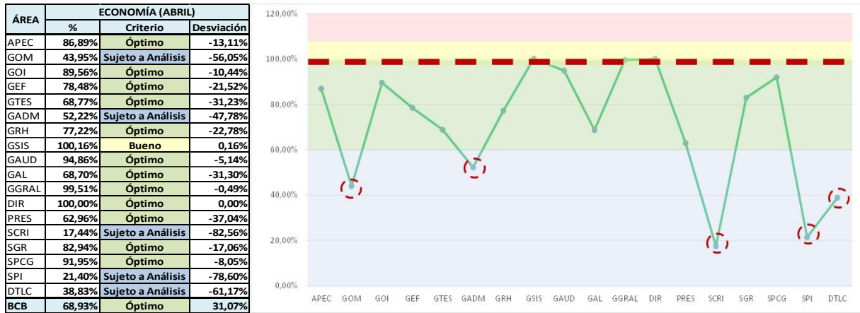
Gráfico N° 2 MEDICIÓN DE ECONOMÍA – GASTOS