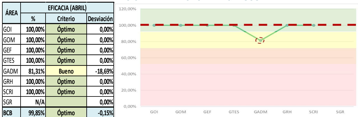
Gráfico N° 5 MEDICIÓN DE LA EFICACIA – INGRESOS

Se generaron Bs475.730.927,53 ; es decir 84,57% respecto a lo programado. Las áreas Sustantivas percibieron Bs475.234.007,42 que representa el 84,76% de lo programado (Bs560.714.954) y las áreas Administrativas y de Asesoramiento Bs496.920,11 que asciende al 27,36% de lo programado (Bs1.816.510).