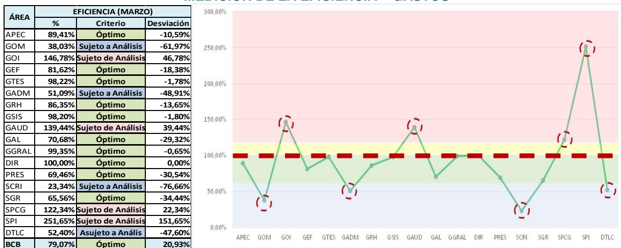
Gráfico N° 3 MEDICIÓN DE LA EFICIENCIA – GASTOS