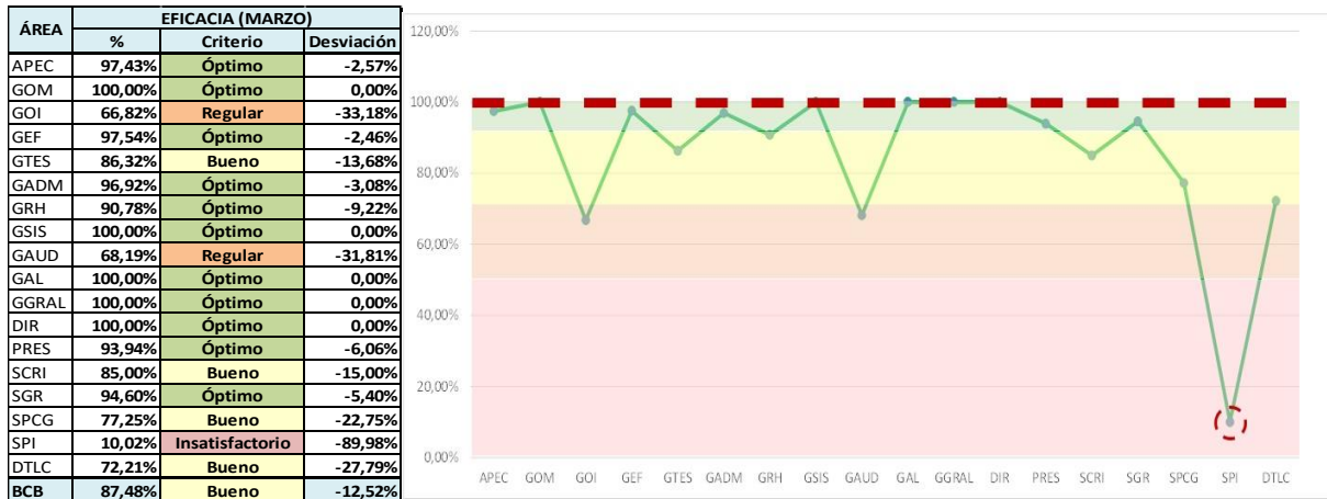
Gráfico N° 1 MEDICIÓN DE LA EFICACIA - GASTOS