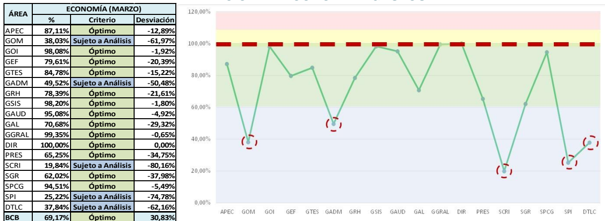
Gráfico N° 2 MEDICIÓN DE ECONOMÍA – GASTOS