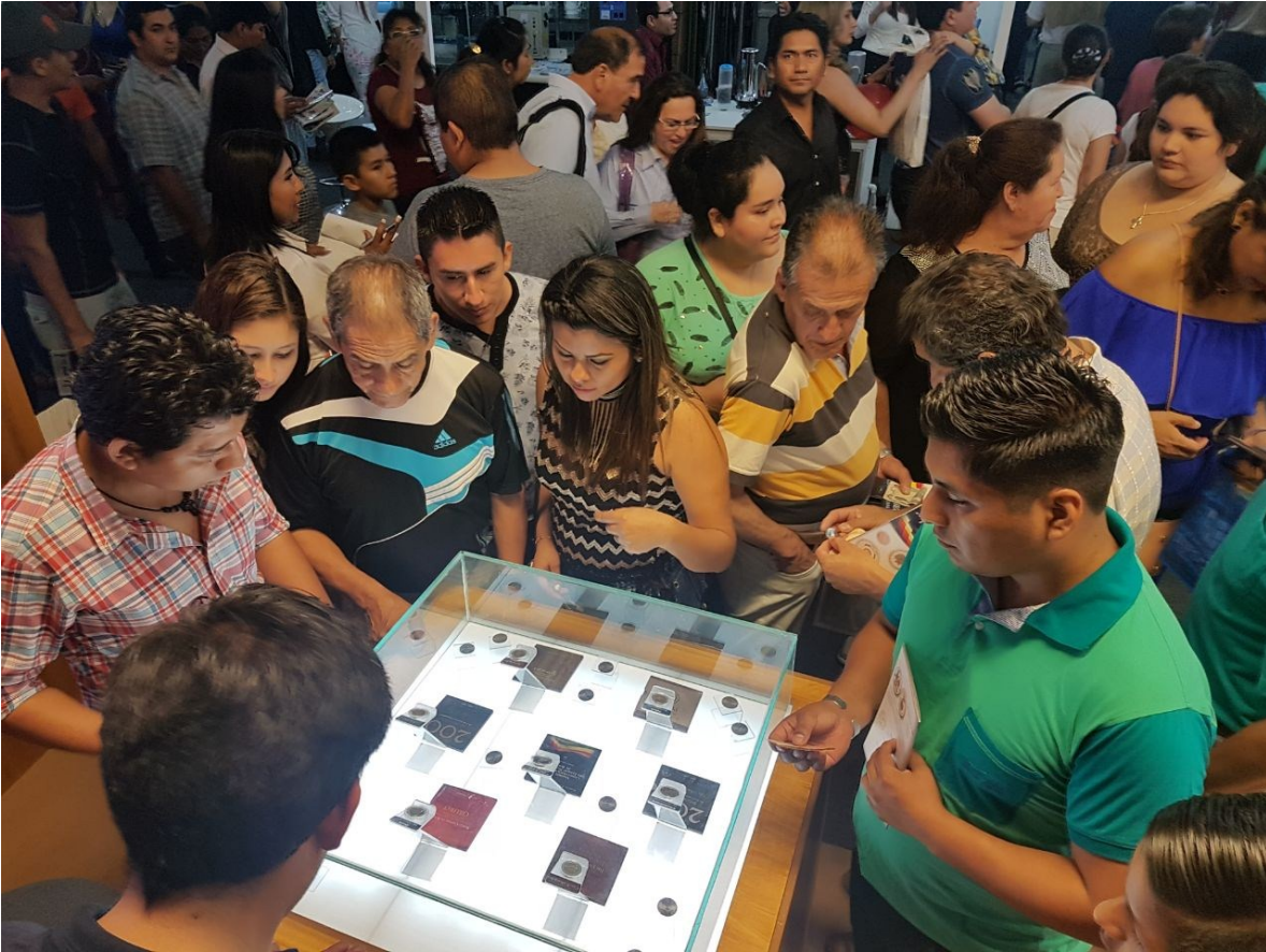
Las monedas conmemorativas tienen alta demanda de la población en la feria.