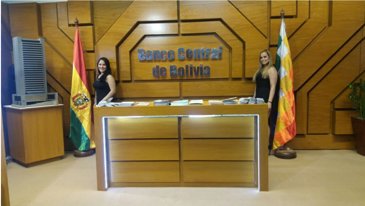
Dos servidoras públicas del BCB en el stand, que es una réplica del piso 27.