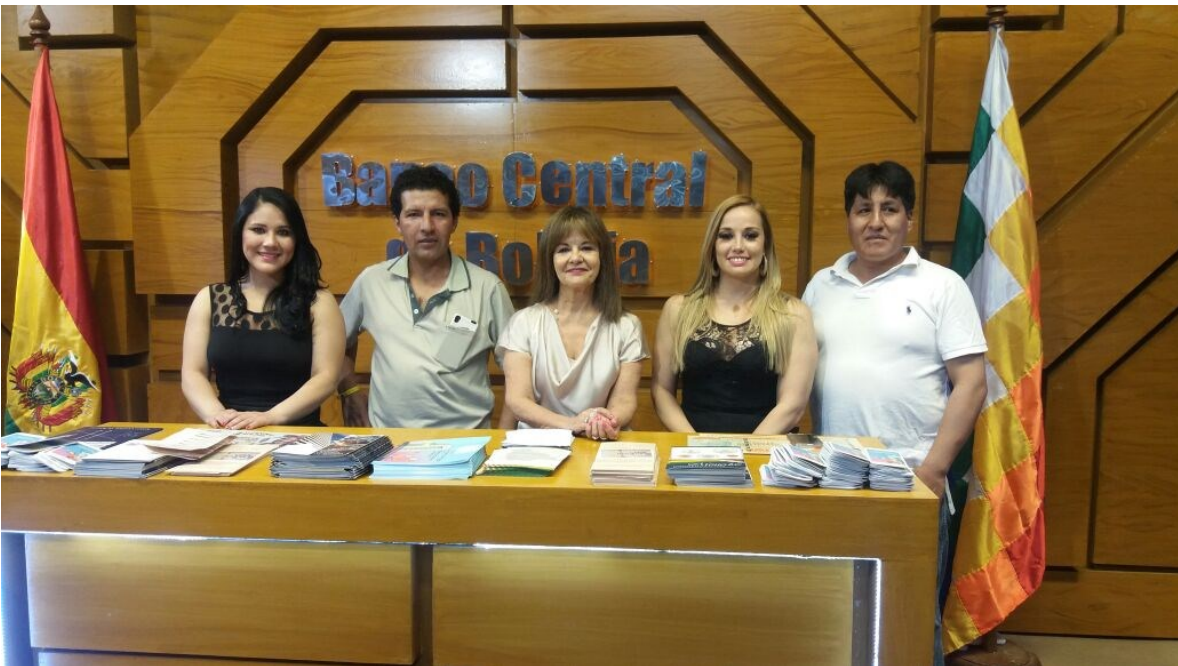
Servidores públicos del Ente Emisor antes de comenzar su ardua labor diaria.