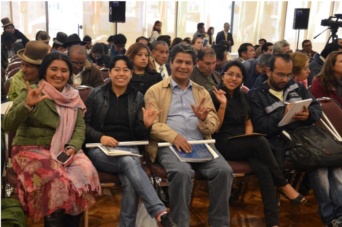
En la imagen representantes de la Asociación de Sordos de La Paz (ASORPAZ) quienes agradecieron la invitación del BCB.