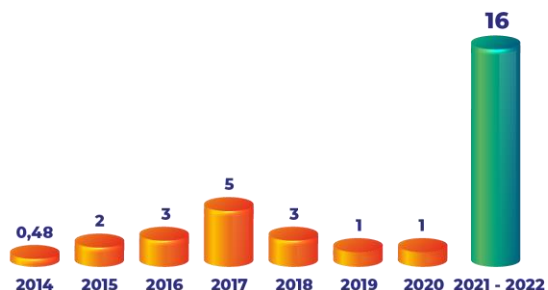
Gráfico 2. COLOCACIONES POR MEDIO DE PAGO ELECTRÓNICOS (En millones de bolivianos)

En Bolivia, siguiendo la tendencia mundial de mayor uso de medios de pagos electrónicos, se logró un récord histórico de Bs16 millones en las colocaciones del Bono Navideño a través de internet (Gráfico 2).