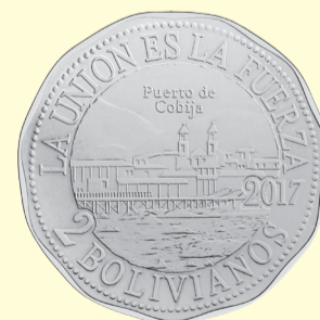
Puerto de Cobija

El BCB recuerda a la población que las monedas de Bs2 actualmente en circulación están vigentes.