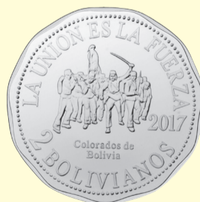
Colorados de Bolivia