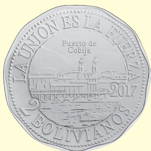
Puerto de Cobija