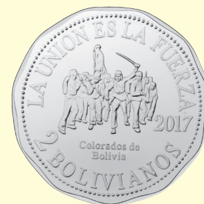
Colorados de Bolivia

El BCB recuerda a la población que las monedas de Bs2 actualmente en circulación están vigentes.