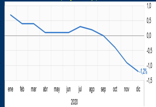
Gráfico 2: Japón - Inflación interanual (En porcentaje)