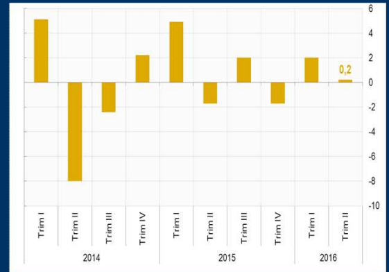
Gráfico 1: Japón - Crecimiento anualizado del PIB (En porcentaje)