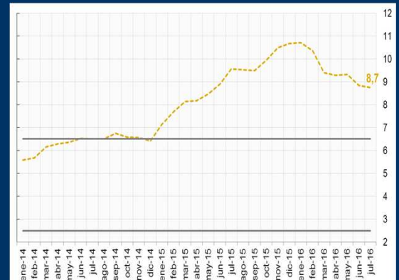
Gráfico 3: Brasil - Inflación interanual (En porcentaje)