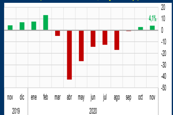
Gráfico 3: Colombia - Ventas minoristas (Variación interanual, en porcentaje)