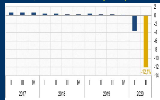
Gráfico 2: Zona Euro - Producto Interno Bruto (Crecimiento trimestral, en porcentaje)