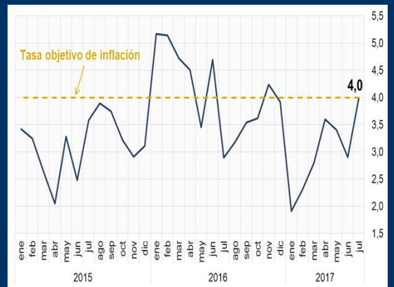
Gráfico 3: Paraguay - Inflación (En porcentaje)