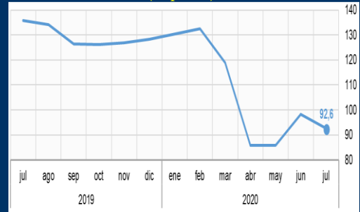
Gráfico 1: Estados Unidos - Índice de confianza del consumidor (En puntos)