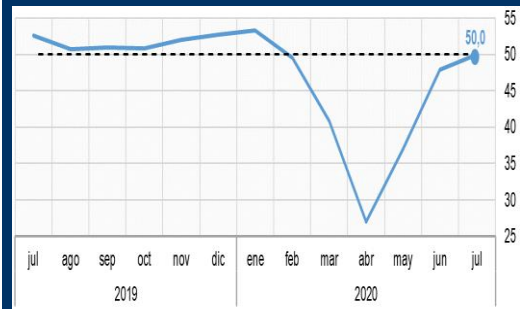
Gráfico 1: Estados Unidos - PMI compuesto (En puntos)

NOTA: 1 A partir del 15/11/2017, los activos del FPAH son invertidos de acuerdo a la composición por monedas de los depósitos del público en el sistema financiero, de manera análoga a las inversiones realizadas por el FONDO RAL.