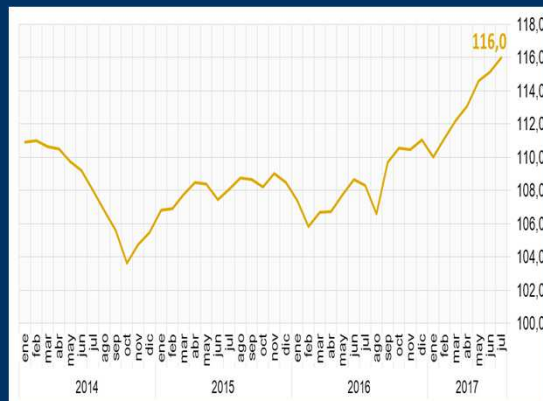
Gráfico 2: Alemania - Índice de situación empresarial (En puntos)