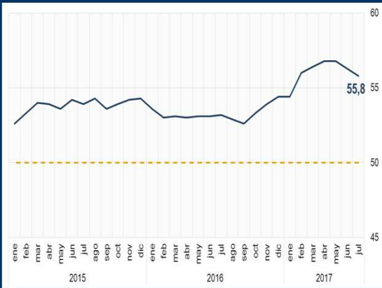
Gráfico 3: Zona Euro - Índice PMI compuesto (En puntos)