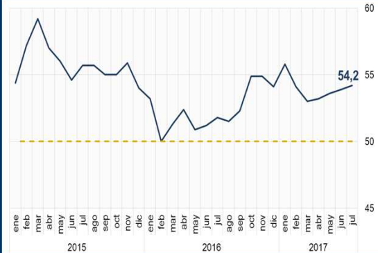
Gráfico 2: EE.UU. - Índice PMI compuesto (En puntos)