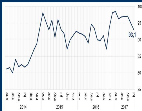
Gráfico 1: EE.UU. - Índice de sentimiento del consumidor (En puntos)