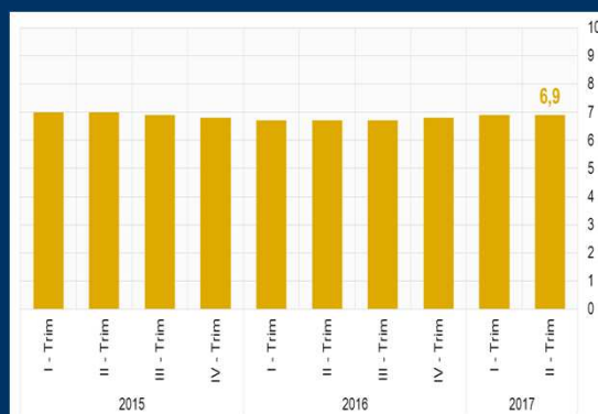
Gráfico 2: China - Tasa de crecimiento del PIB (En porcentaje)