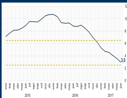
Gráfico 2: Brasil - Inflación interanual (En porcentaje)