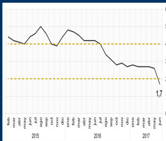
Gráfico 3: Chile - Inflación interanual (En porcentaje)