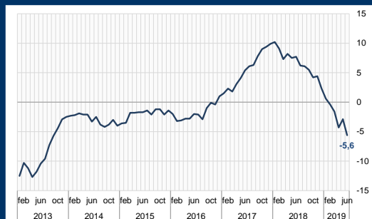
Gráfico 2: Zona Euro - Confianza empresarial (En puntos)