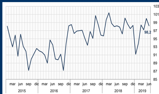
Gráfico 1: EE.UU. - Sentimiento del consumidor (En puntos)