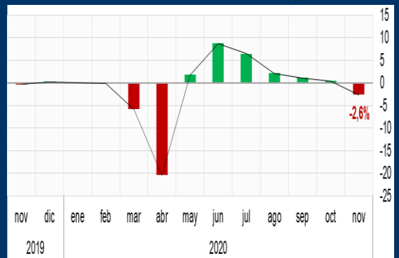
Gráfico 2: Reino Unido - Producto Interno Bruto (Variación mensual, en porcentaje)