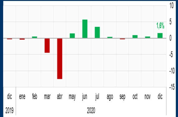
Gráfico 1: Estados Unidos - Producción industrial (Variación mensual, en porcentaje)

NOTA: 1 A partir del 15/11/2017, los activos del FPAH son invertidos de acuerdo a la composición por monedas de los depósitos del público en el sistema financiero, de manera análoga a las inversiones realizadas por el FONDO RAL.