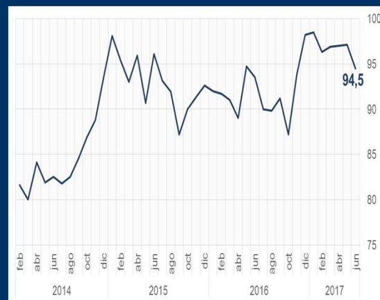
Gráfico 1: EE.UU. - Sentimiento del consumidor (En puntos)