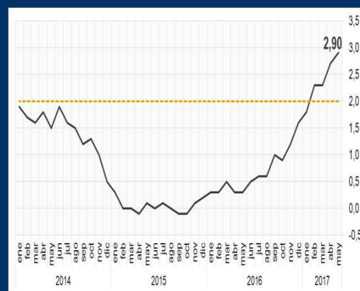
Gráfico 3: Reino Unido - Variación interanual del índice de precios al consumidor (En porcentaje)