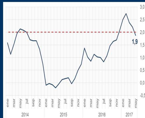
Gráfico 1: EE.UU. - Inflación (En porcentaje)