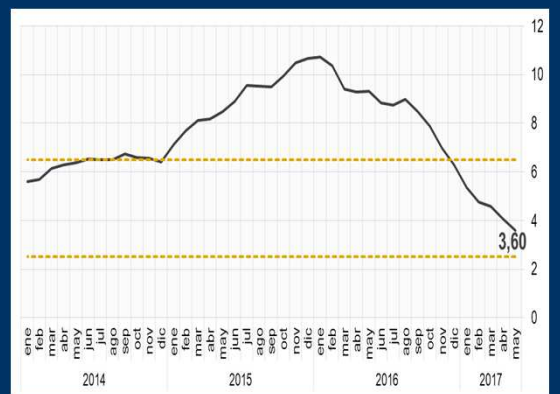
Gráfico 3: Brasil - Índice de precios al consumidor (En porcentaje)