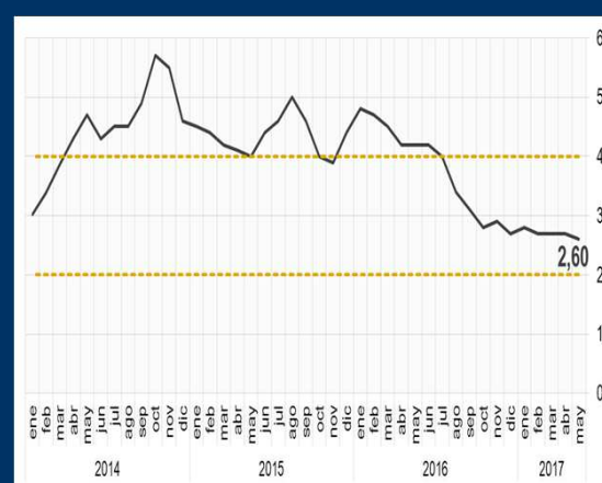
Gráfico 3: Chile - Índice de precios al consumidor (En porcentaje)