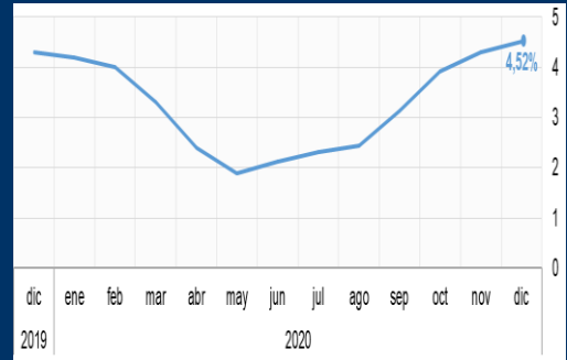
Gráfico 3: Brasil - Inflación interanual (En porcentaje)