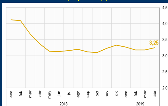
Gráfico 3: Colombia - Inflación a 12 meses (En porcentaje)