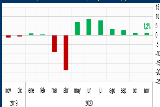
Gráfico 2: Brasil - Producción industrial (Variación mensual, en porcentaje)