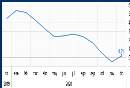
Gráfico 1: China - Inflación interanual (En porcentaje)