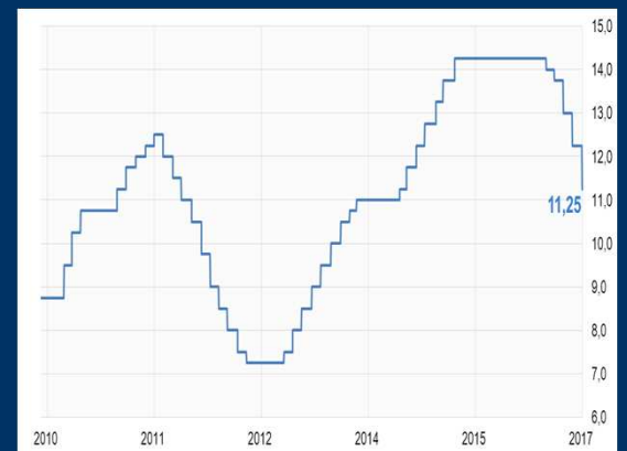
Gráfico 3: Brasil - Tasa de política monetaria - SELIC (En porcentaje)