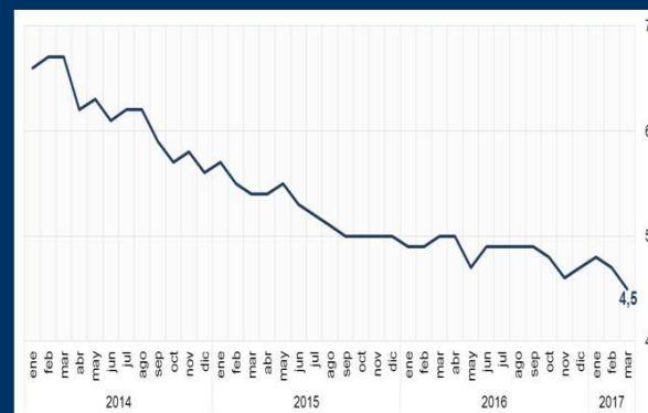
Gráfico 1: EE.UU. - Tasa de desempleo (En porcentaje)