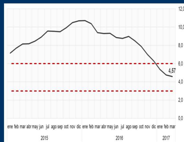
Gráfico 3: Brasil - Inflación interanual (En porcentaje)