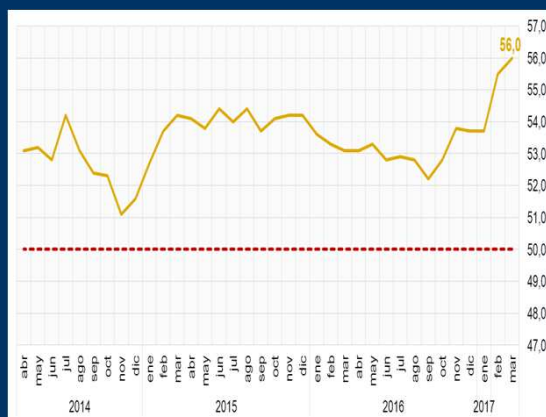
Gráfico 2: Zona Euro - Índice PMI servicios (En puntos)