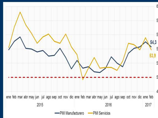
Gráfico 1: EE.UU. - Índices de gestores de compra PMI (En puntos)