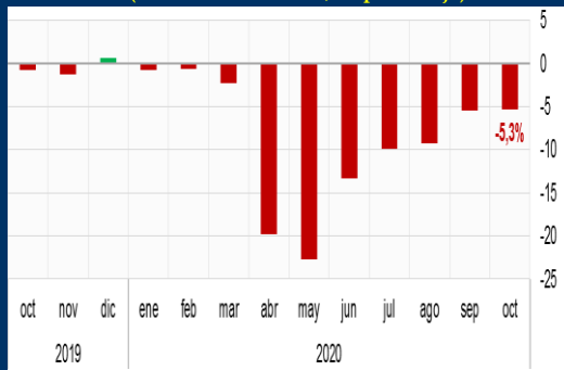
Gráfico 3: México - Índice global de la actividad económica, IGAE (Variación interanual, en porcentaje)