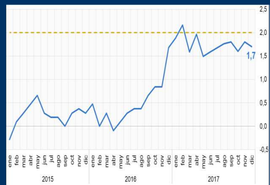
Gráfico 2: Alemania - Inflación (En porcentaje)