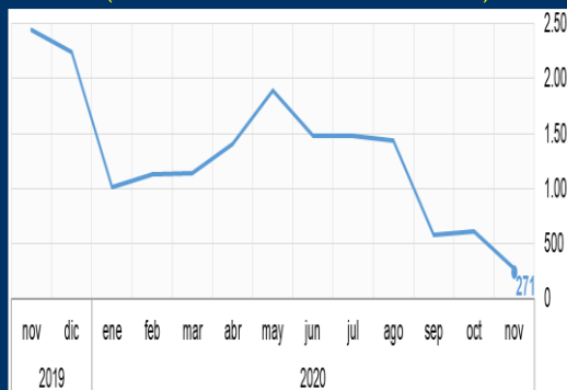
Gráfico 3: Argentina - Balanza comercial (En millones de dólares estadounidenses)

Fuente: Oficina Nacional de Estadísticas - Reino Unido