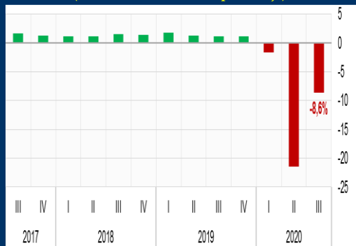
Gráfico 2: Reino Unido - Producto Interno Bruto (Variación interanual, en porcentaje)