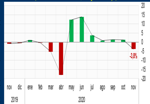
Gráfico 2: Reino Unido - Ventas minoristas (Variación mensual, en porcentaje)