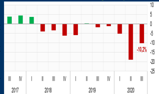
Gráfico 3: Argentina - Producto Interno Bruto (Variación interanual, en porcentaje)