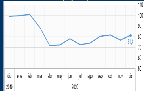
Gráfico 1: Estados Unidos - Índice de Sentimiento del Consumidor Michigan (En puntos)

Fuentes: Universidad de Michigan, Eurostat, DANE - Colombia, Reuters.