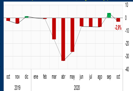
Gráfico 3: Argentina - Producción industrial (Variación interanual, en porcentaje)