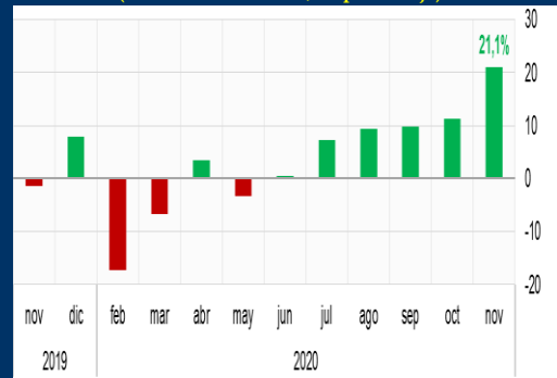
Gráfico 2: China - Exportaciones (Variación interanual, en porcentaje)