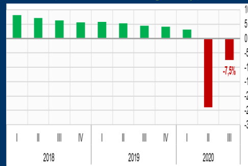
Gráfico 2: India - Producto Interno Bruto (Variación interanual, en porcentaje)