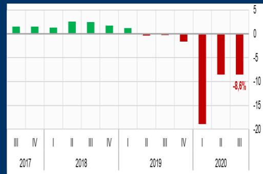
Gráfico 2: México - Producto Interno Bruto (Variación interanual, en porcentaje)