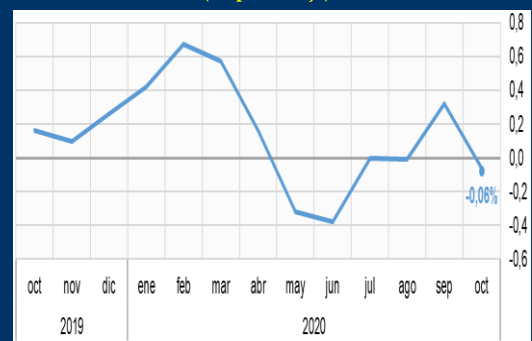
Gráfico 3: Colombia - Inflación mensual (En porcentaje)