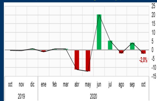
Gráfico 2: Zona Euro - Ventas minoristas (Variación mensual, en porcentaje)