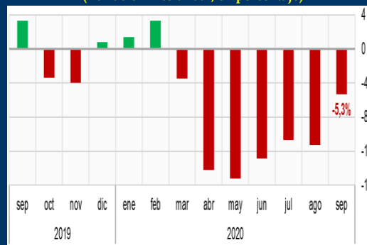
Gráfico 3: Chile - Indicador mensual de actividad económica - IMACEC (Variación interanual, en porcentaje)