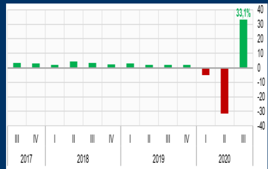
Gráfico 1: Estados Unidos - PIB trimestral (Variación interanual, en porcentaje)

Fuentes: US Bureau of Economic Analysis, Eurostat, INE - Chile, Reuters.