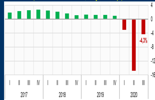
Gráfico 2: Zona Euro - PIB trimestral (Variación interanual, en porcentaje)