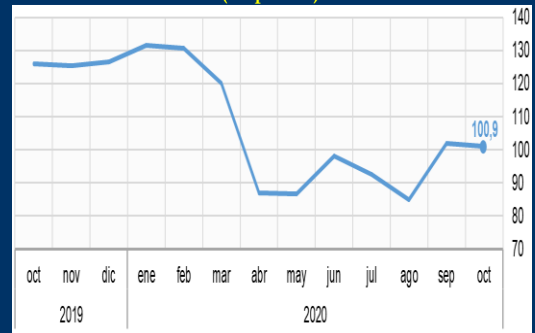
Gráfico 1: Estados Unidos - Índice de confianza del consumidor (En puntos)