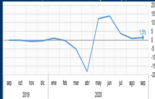
Gráfico 3: Reino Unido - Ventas minoristas (Variación mensual, en porcentaje)