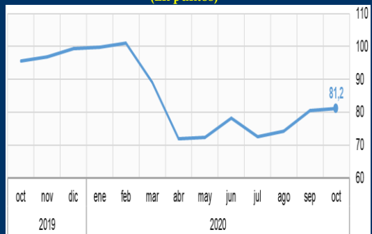
Gráfico 2: Estados Unidos - Índice de Sentimiento del Consumidor Michigan (En puntos)