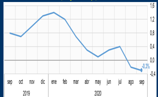
Gráfico 2: Zona Euro - Inflación interanual (En porcentaje)