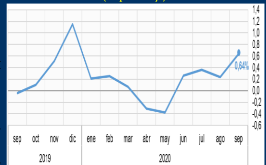
Gráfico 2: Brasil - Inflación mensual - IPCA (En porcentaje)

Fuente: Oficina Nacional de Estadísticas - Reino Unido