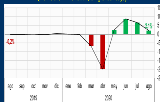
Gráfico 2: Reino Unido - PIB mensual (Variación mensual, en porcentaje)