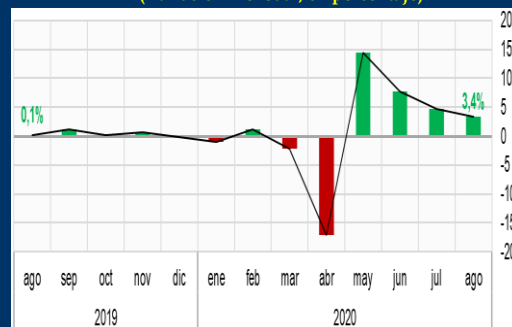
Gráfico 3: Brasil - Ventas minoristas (Variación mensual, en porcentaje)